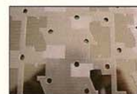
キレイになった表面