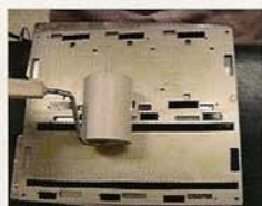
クリーニングして繰り返し使用可能。