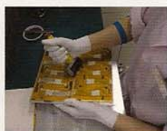
ゴムローラを使って固定する。